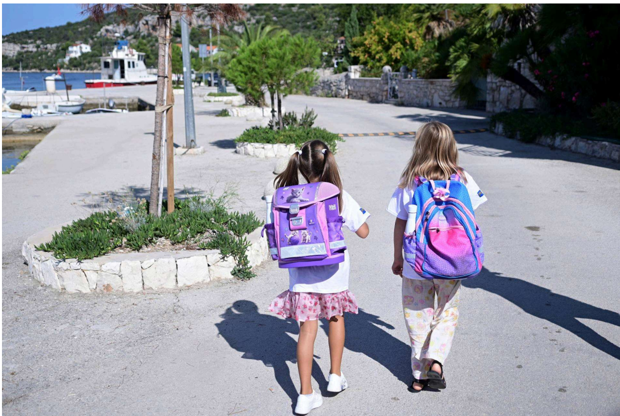
Učenice na Drveniku

"Ako otok nije dobar za život zimi, nije održiv teritorij", stoji u jednom od ESPON-ovih izvješća. Upravo tu otočani vide najveći jaz između europskih načela i hrvatske prakse. Hrvatska, kažu, formalno slijedi EU pravila, ali u praksi koristi sivu zonu fleksibilnosti: novac se povlači, ali se troši tamo gdje je politički i administrativno najlakše.